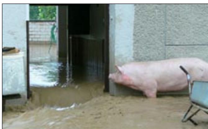
Majíčkovi museli vyhnat prasata z chlívků, aby se neutopila.