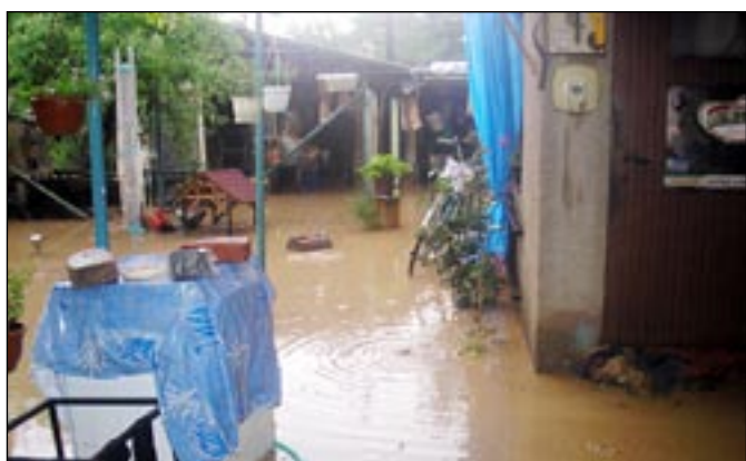
Taky u Brhelů se „plavalo“.