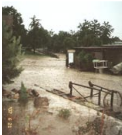
21. 6. Dům u jezera.