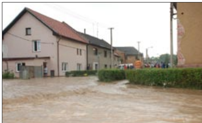
Pohled ke Kočařovému.