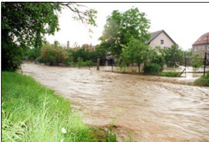
Obvykle klidný potůček s minimem vody. Jak ve Zlobicích, tak i v Bojanovicích. Nikoho by ani ve snu nenapadlo kolik škody a neštěstí mohou přinést.