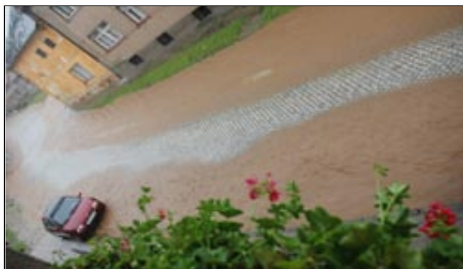
Cesta od Popovic před Cencingrovým.