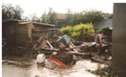
14. 6. Zídka od Brablíků.

Zkáza, kterou za sebou voda zanechala se nedá ani popsat. Hlína z polí, která se proměnila v páchnoucí bahno, byla všude. Místní byli v šoku. Nikdo ale na nic nečekal. Na slzy nebyl čas. Muselo