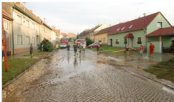
Všichni, kdo bydlí kolem potoka, si nepříjemného bahna „užili“.