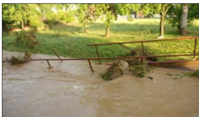
Odplavený obecní mostek mezi Lehkoživovým a Ohradou.