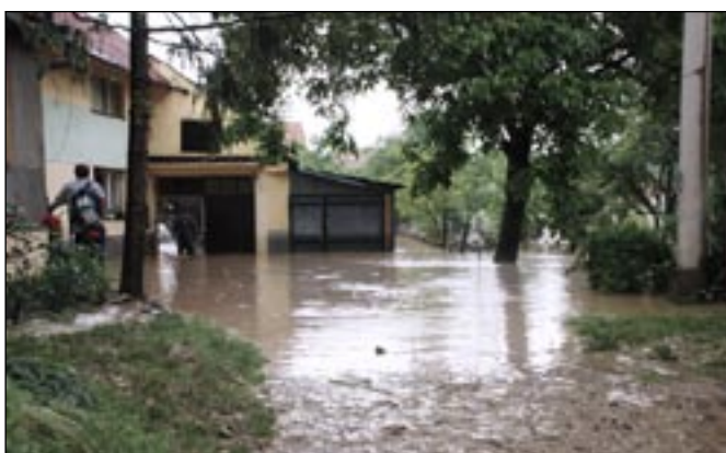
Další z rodin, která byla citelně zasažena. Lehkoživovi.