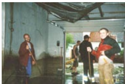
14. 6. Zdatní pomocníci.

škvírek a tak se i se svým milovaným vercajkem musel rozloučit. U Brablíků byla také zkáza. Voda s bahnem se dostala přes dveře na chodbu, kuchyň a do kotelny. Nejhorší bylo, že se bahno dostalo přes okno do obývacího pokoje pod plovoucí podlahu. Na dvoře bylo bahno také všude. Rozhodně jejich pes „PROSTĚ PŘEŽIL!“ Nikdo sice nechápe jak, protože voda v jeho kotci dosahovala