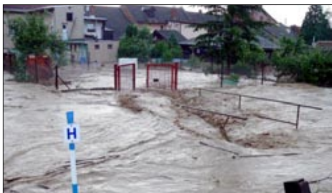
Síla vody byla obrovská a razila si cestu kudy to jen šlo. Pohled zezadu k Horákovému.