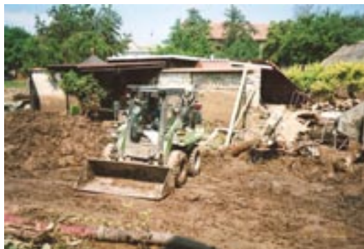
15. 6. U Brablíků na dvoře.

se bohužel vzhledem k neúměrnému vtoku do počáteční skruže nevešla a musela si cestu zvolit nad onou vpusť. To způsobilo, že proud vody se začal valit přes zahradu Piškulů, dále předzahrádku Haškovic a na křižovatku na Bařině, potom následně tekla voda přes zahradu Libenských a Kozárků (Raclavských), kde nepomohla ani „protipovodňová“ zídka a za-