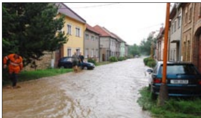
Další zaplavená část obce. Husének.