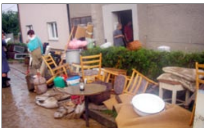
Rodina Majíčkova patřila k jedněm z nejpostiženějších.