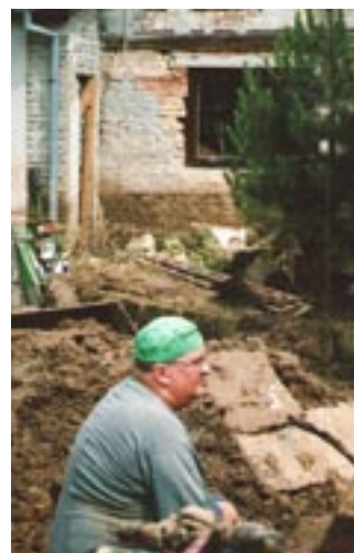
14. 6. Nešťasný majitel.