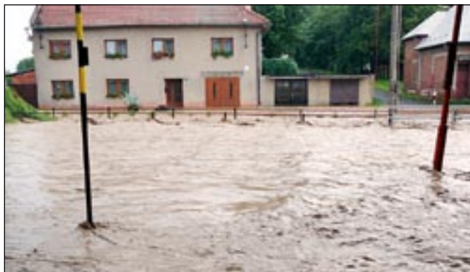
Před Diasovým až ke Skoupilovému se vytvořilo velké jezero.