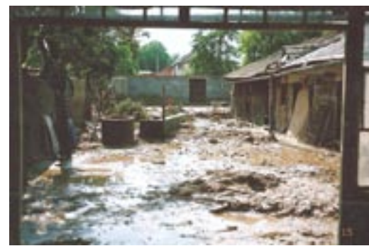
15.6. U Kozárků (Raclavských) na dvoře.

Do rána bylo co dělat, spát se toho dne vůbec nešlo. A tak se pokračovalo ještě další dny. Naštěstí kontejnery, které byly zajištěny od obce zdárně odvážely a přivázely technické služby města Kroměříže a tak mohlo UNC, které nám velmi pomohlo s odstraňováním