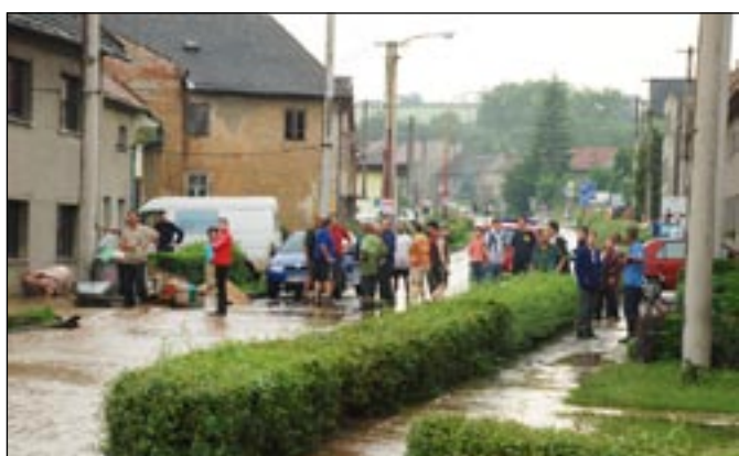
Lidé by si měli pomáhat, říká se. Zlobičtí to umí.