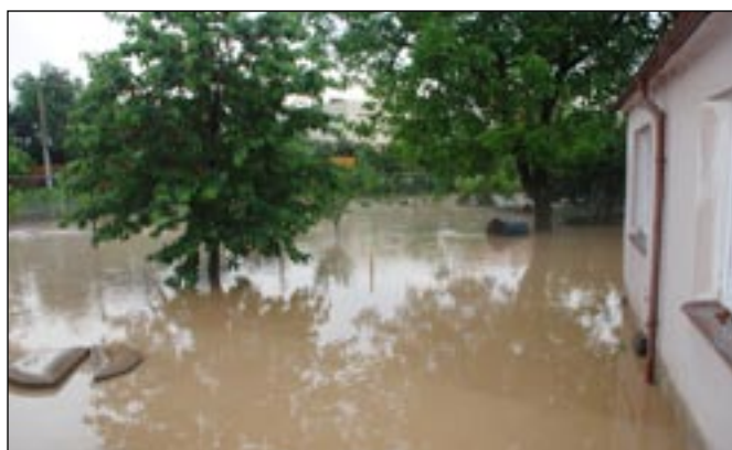
Na dvoře u Kočařů. Od Lehkoživového se vytvořilo souvislé jezero.