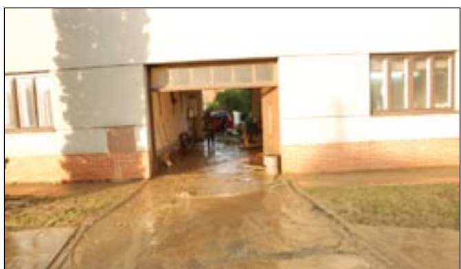
Nejinak tomu bylo u Zapletalů.