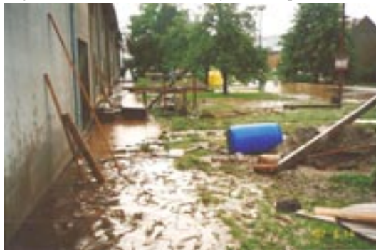
14. 6. 2007 na chodníčku v Bojanovicích.

Dle očitých svědectví některých občanů Bojanovic, voda, v jindy nepatrně čičůrkajícím potůčku plynoucího přes střed naší obce se v místech, kde končí jeho korytka stékajícího z polí u Libenských na Bařině a měla dále vtékat do jindy postačujících betonových skruží vedoucích přes Bojanovice směrem na Měrůtky,