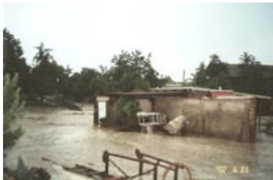
21. 6. Tak znova.

... Nebo když přijela charita a dovezla dezinfekční prostředky. Byli jsme rádi za každou vzpruhu. Makalo se o stošest.