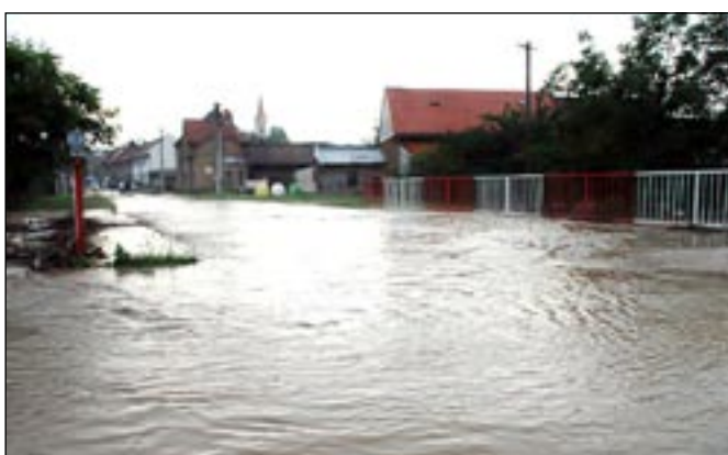
Snad bude tato fotka už jen historie, která se nebude opakovat.