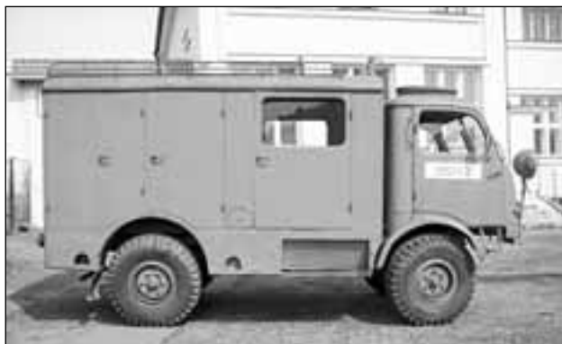
V květnu byla do sboru zakoupena starší Tatra 805, tzv. „kačena“. Počátkem roku nás čeká rekonstrukce.