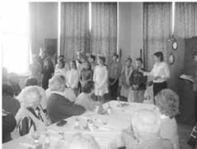
Ať všechť zísce zvonků štěstí zdraví, lásku a klid v štěstí!

Ze tato akce nebyla zbytečná, potvrzuje účast 44 seniorů.