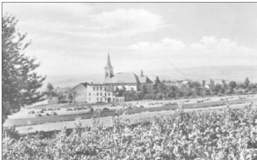
Pohled na Zlobice z Větráku jak si dnes asi málokdo pamatuje.