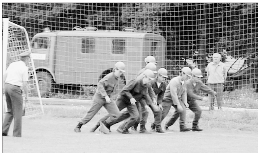
Členové družstva SDH Zlobice po odstartování.